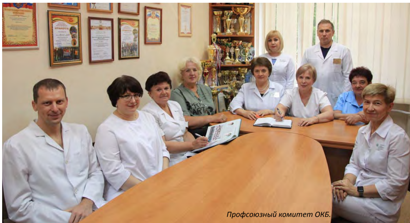
Профсоюзный комитет ОКБ.

Самое, пожалуй, важное на сегодняшний день направление работы – социальная поддержка работников больницы. Это не только оказание материальной помощи на лечение, на