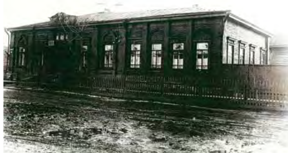
Внешний фасад туб диспансера 1936 г.

В этом году отмечает свое 100-летие бюджетное учреждение здравоохранения Омской области «Клинический противотуберкулезный диспансер».